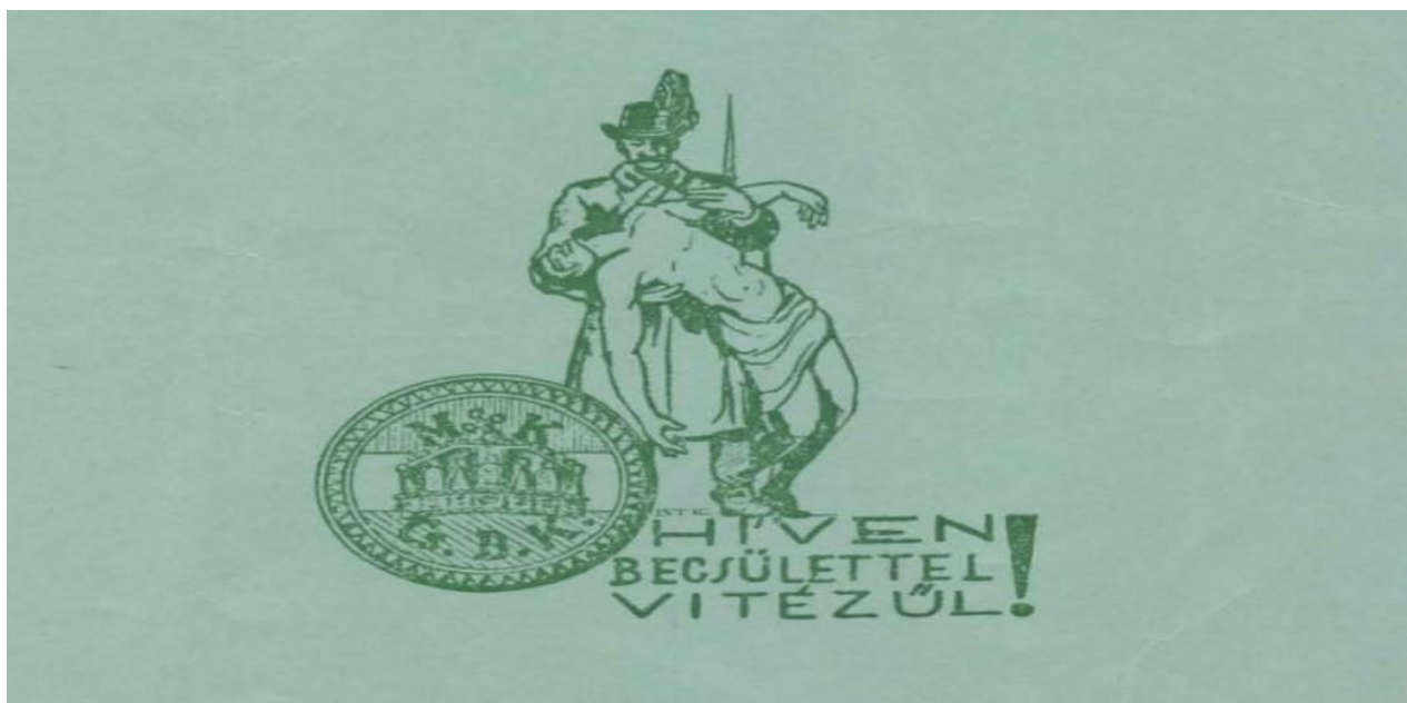
A Bajtársi Levél borítójának illusztrációja, amelyen látható az MKCSBK címere, a Csendőrvértanúk szobrának rajza és a szervezet mottója. (Bajtársi Levél, 1964. 11–12. sz.)

A hátoldalon ekkor a magyar kiscímer volt látható egy babérkoszorúval övezve, alatta pedig a Magyar Hiszekegy első három sora volt olvasható, ami a Horthy-korszak nemzeti imája lett és kifejezte a korszak társadalmának azon egységét, amely a területi határrevízió kérdésével volt kapcsolatos. Megjelentetése a hátoldalon is erősíti a Horthy-korszak nemzeti-keresztény diskurzusához való kötődést és annak továbbvitelét; a magyar emigrációs közösségek még akár két évtized után is ennek élővé tételére tettek próbálkozásokat. 390