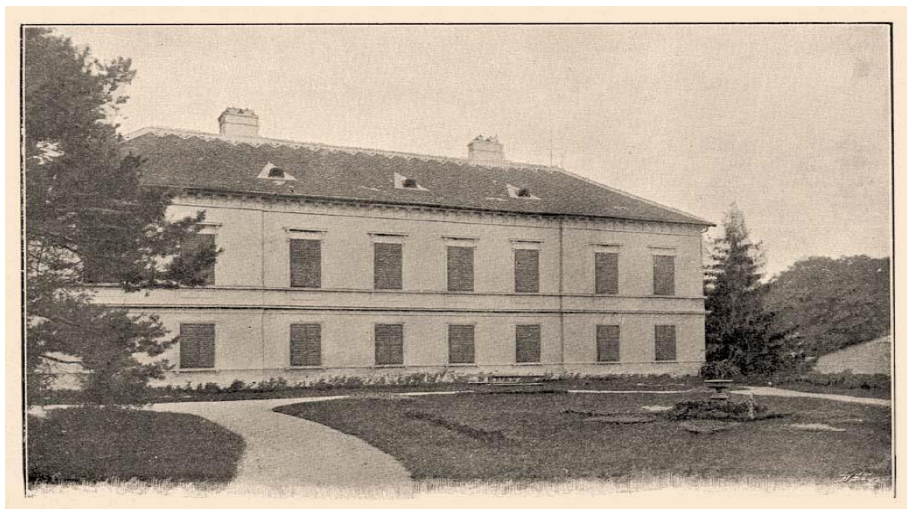
5. fotó: Kornfeld Zsigmond vidéki kastélya Rakovicon, azaz Rákfalván

Forrás: Borovszky Samu szerk.: Magyarország Vármegyéi és Városai, Nyitra Vármegye: 118. p.